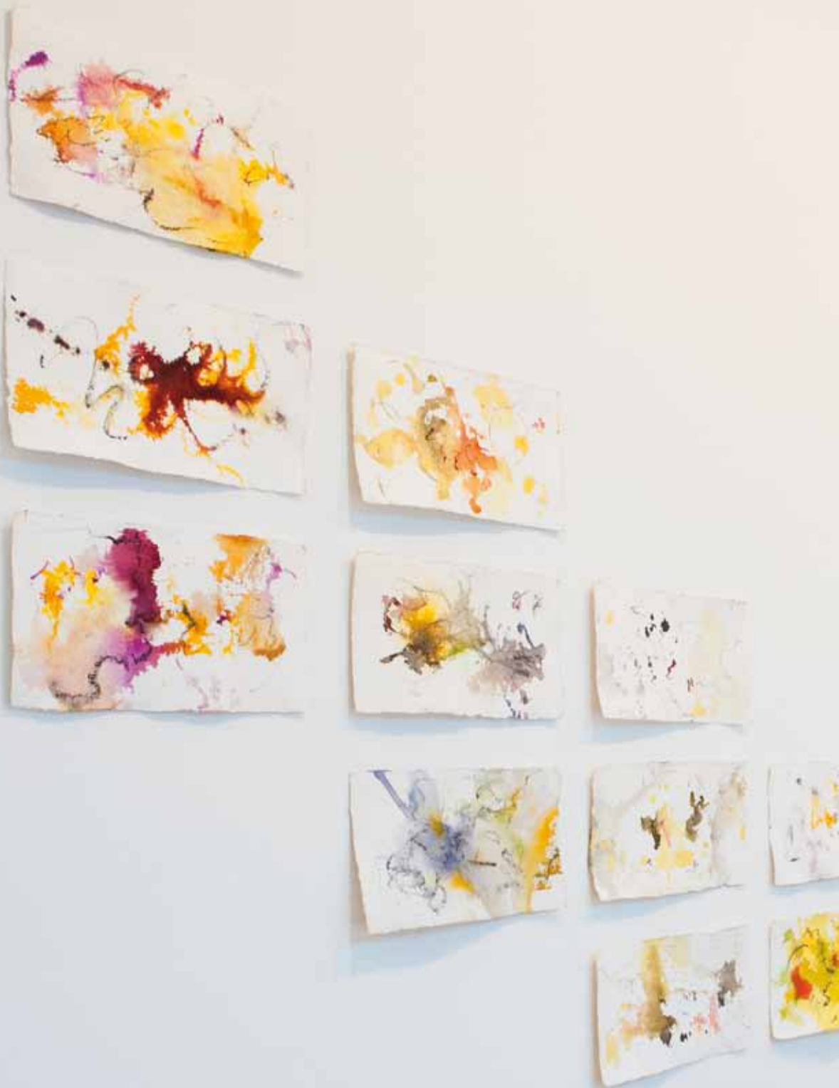
Ausschnitt aus der Installation: XYZ 1–29 29 Bilder, Tusche auf Büttenpapier, 2016