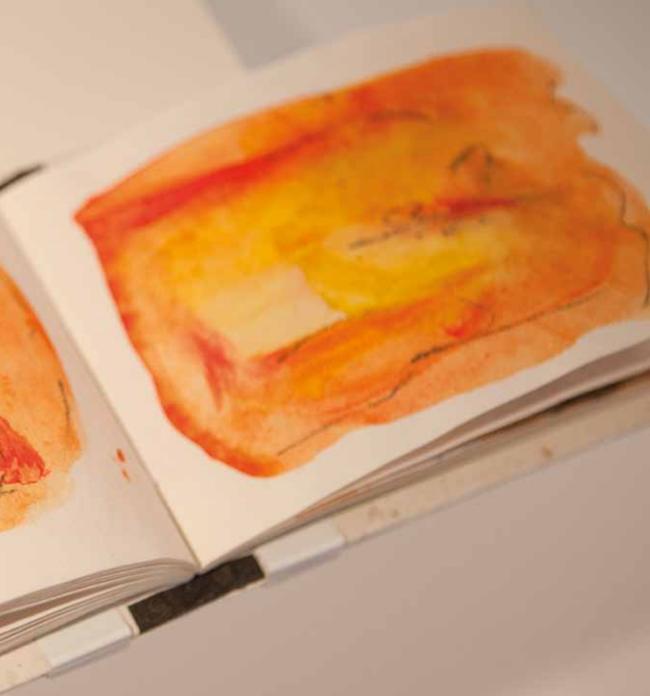
Skizzenbuch „ Strong in Hope “ 32 Seiten beidseitig bemalt, mehrfarbig: Mischtechnik auf Büttenpapier, 2016