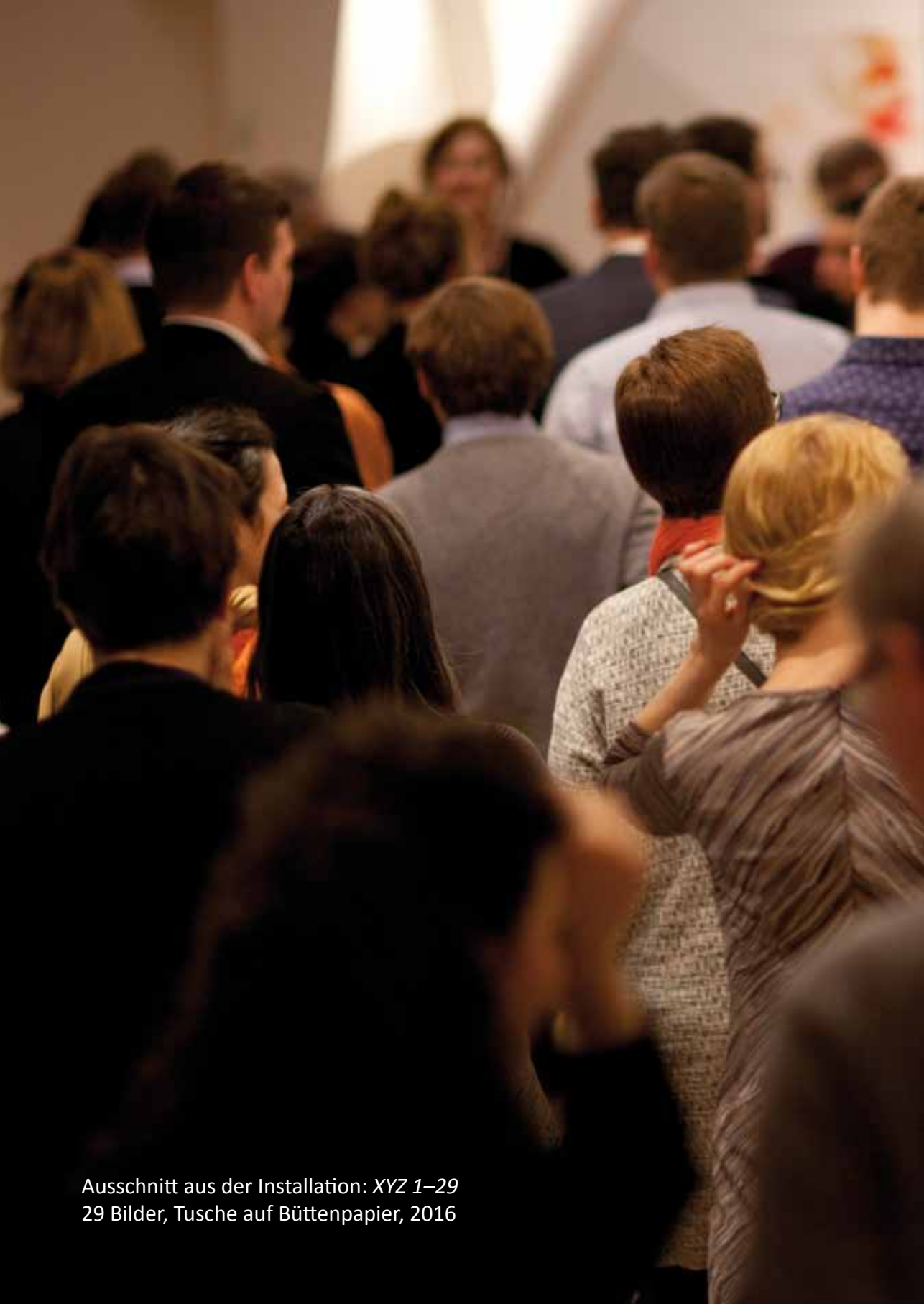
Ausschnitt aus der Installation: XYZ 1–29 29 Bilder, Tusche auf Büttenpapier, 2016