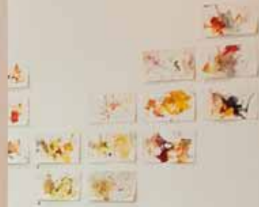
Faden-Frei 1, 2 Mischtechnik auf Büttenpapier, 2015