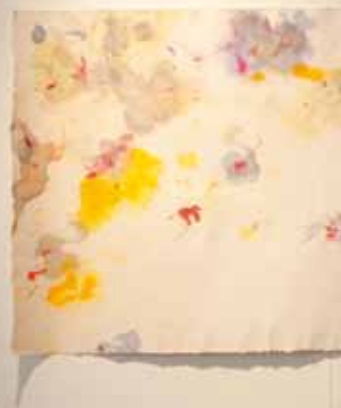
Fliegen 1, 2 und 3 Tusche auf Büttenpapier, 2016