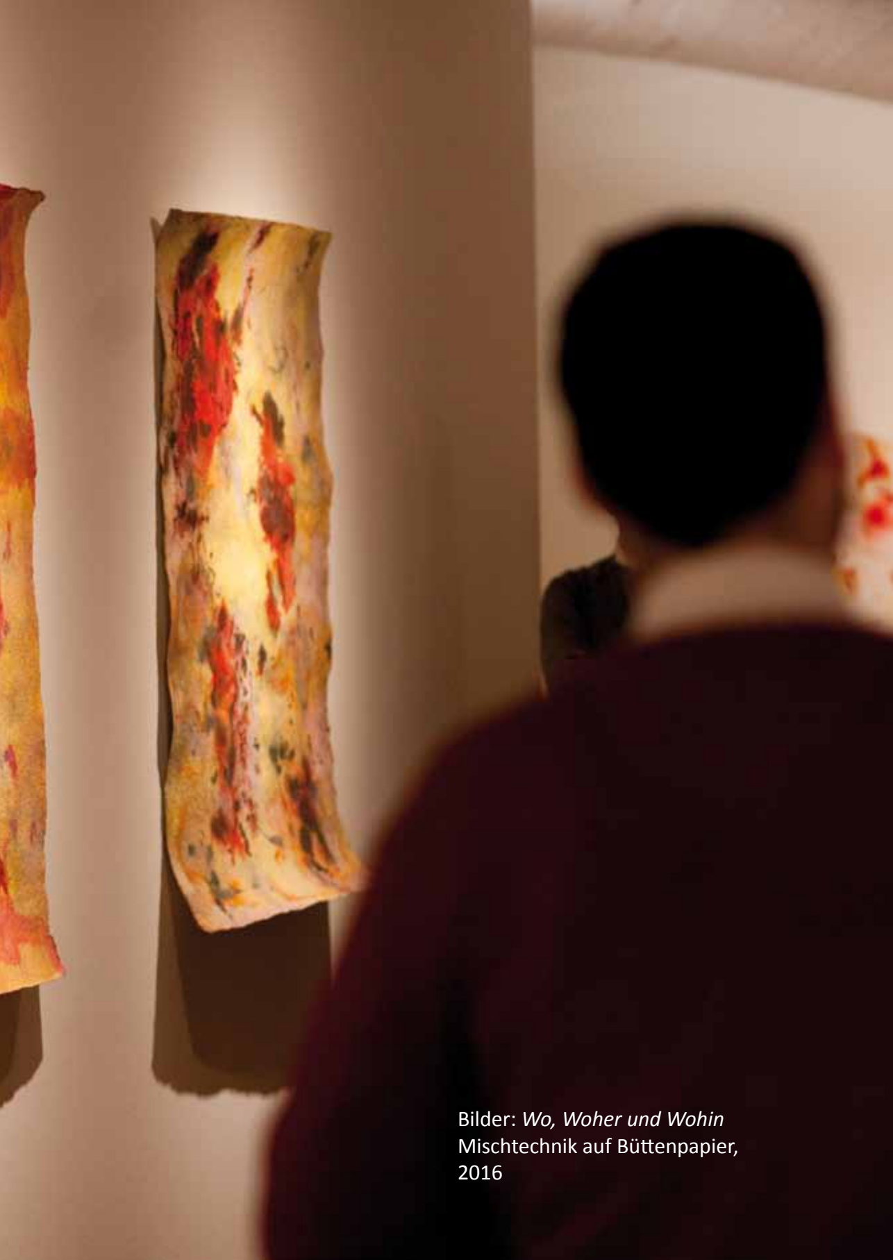
Bilder: Wo, Woher und Wohin Mischtechnik auf Büttenpapier, 2016