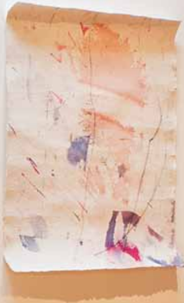
Unter-Wegs 1 Tusche auf Büttenpapier, 2015