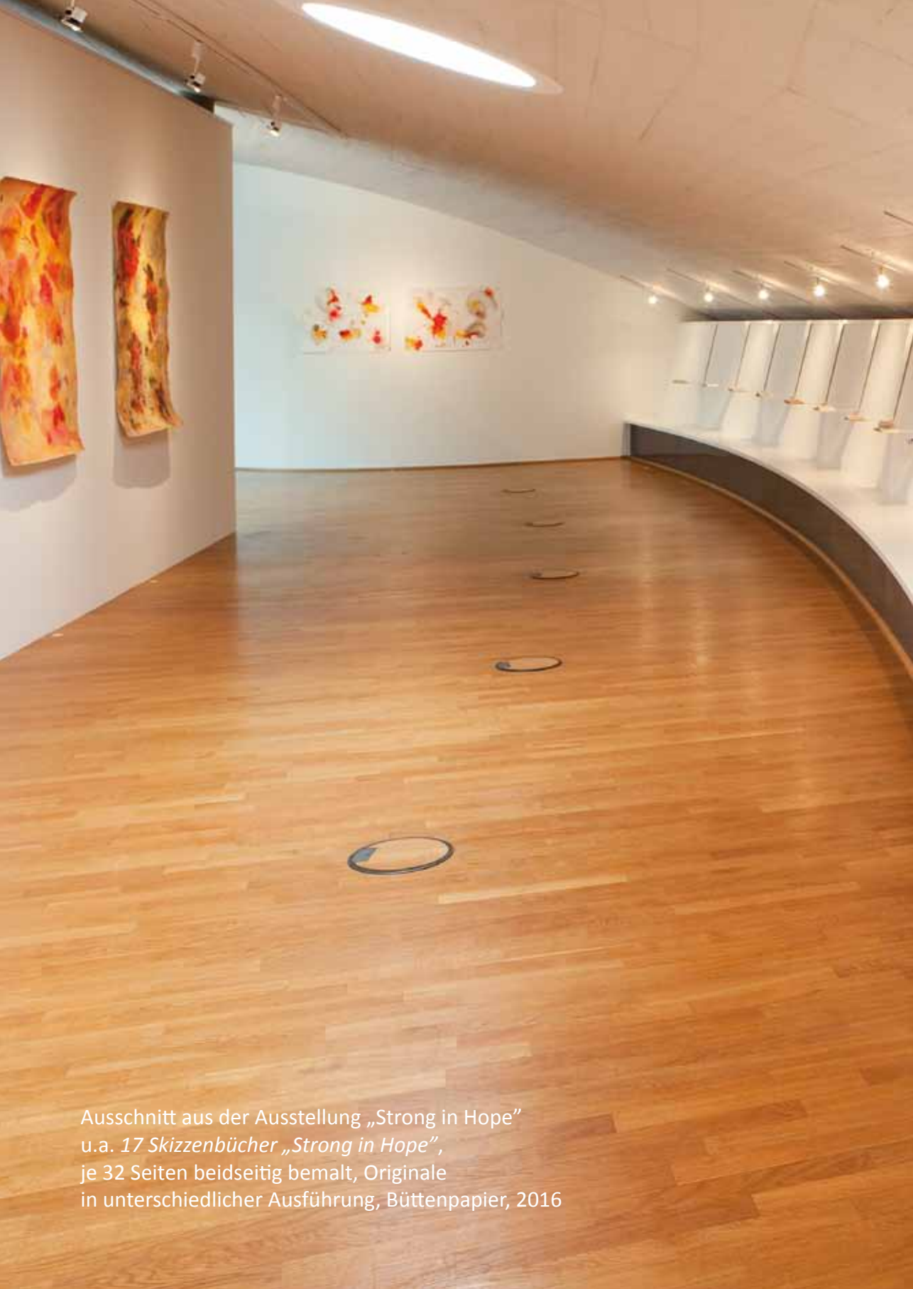
Ausschnitt aus der Ausstellung „Strong in Hope“ u.a. 17 Skizzenbücher „Strong in Hope“, je 32 Seiten beidseitig bemalt, Originale in unterschiedlicher Ausführung, Büttenpapier, 2016